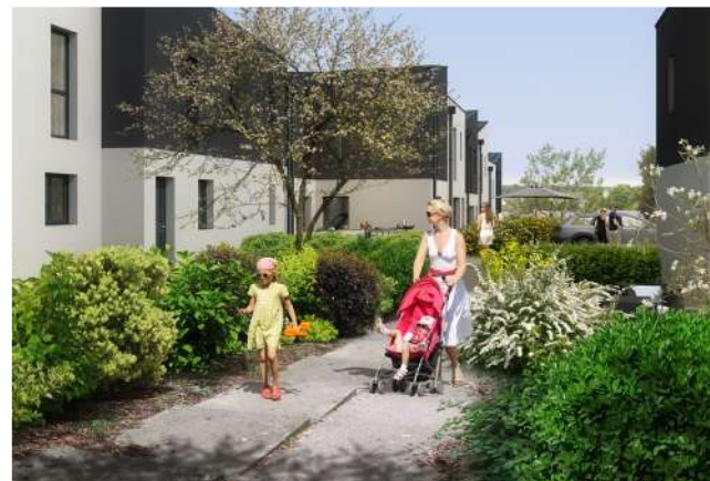
Perspectives non contractuelles réalisées par IMAGE IN SITU