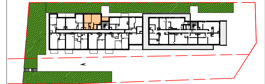
Plan de situation